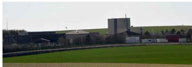
L'Andra a besoin de 655 ha pour son projet Cigéo.

On sait que des associations ont engagé un recours auprès du Conseil d'État contre l'arrêté ministériel qui a validé la DUP. Après que le Conseil constitutionnel, sollicité pour trancher une question prioritaire de constitutionnalité, a jugé conforme les modalités de création du centre de sto-